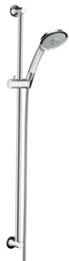
XXL 100 Raindance® Classic 100 AIR 3jet/ Unica® Classic Set 90 cm # 27841, -000, -820 65 cm # 27843, -000, -820 (o. Abb.) Unica® Classic (o. Abb.) Brausenstange mit Sensoflex Brausenschlauch 1,60 m 90 cm # 27616, -000, -820 65 cm # 27617, -000, -820