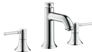
3-Loch Waschtischarmatur # 14113, -000, -820