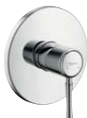
Einhebel-Brausenmischer Unterputzmontage # 14165, -000, -820