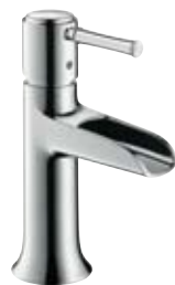
Einhebel-Waschtischmischer Natural # 14127, -000, -820