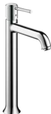
Einhebel-Waschtischmischer Highriser # 14116, -000, -820