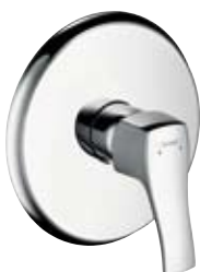
Einhebel-Brausenmischer Unterputzmontage # 31676, -000, -820