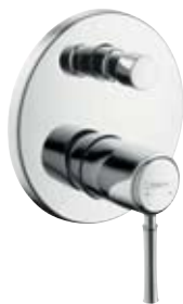
Einhebel-Wannenmischer Unterputzmontage # 14145, -000, -820 Unterputzmontage mit Sicherungskombination # 14146, -000, -820 (o. Abb.)