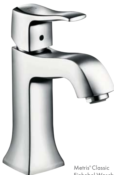
Metris® Classic Einhebel-Waschtischmischer

Metris Classic zeigt die moderne Klassik mit ihren bekannten geometrischen Grundformen, mit klassischen Elementen vervollständigt, die Schwung und Präzision in dekorativer Linie weiterführen. Dieser Stil hat die Wärme des Bekannten. Moderne Klassik ist Perfektion der gesamten Komposition. Sie ist das Zusammenspiel von Formen, elegant und perfekt ausgewogen, reduziert und ohne Opulenz. Metris Classic bietet durchdacht hochwertige Details im Bad inmitten geschätzter Dinge.