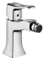
Einhebel-Bidetmischer # 31275, -000, -820