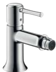
Bidetmischer # 14120, -000, -820