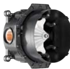
iBox® universal Grundset für Unterputzinstallation # 01800180