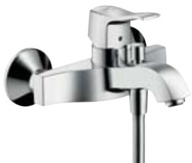
Einhebel-Wannenmischer Aufputzmontage # 31478, -000, -820