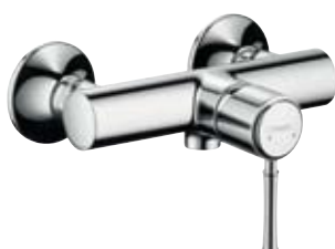
Einhebel-Brausenmischer Aufputzmontage #14161, -000, -820