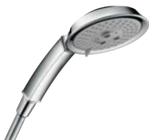
Raindance® Classic 100 AIR 3jet Handbrause mit Rain AIR, Whirl AIR und Balance AIR # 28548, -000, -820