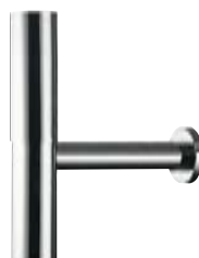
Flowstar® Designsiphon # 52100, -000, -820