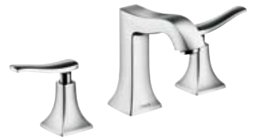
3-Loch Waschtischarmatur # 31073, -000, -820