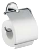
Papierrollenhalter # 41623, -000, -820