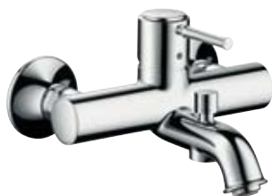
Einhebel-Wannenmischer Aufputzmontage # 14140, -000, -820