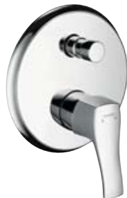
Einhebel-Wannenmischer Unterputzmontage # 31485, -000, -820 Unterputzmontage mit Sicherungskombination # 31486, -000, -820 (o. Abb.)