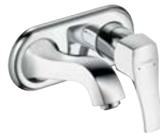
2-Loch Wandarmatur 165 mm # 31000, -000, -820 225 mm # 31003, -000, -820 (o. Abb.)