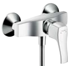
Einhebel-Brausenmischer Aufputzmontage # 31672, -000, -820