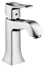
Einhebel-Waschtischmischer # 31075, -000, -820 Einhebel-Waschtischmischer ohne Ablaufgarnitur # 31077, -000, -820