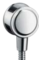
Fixfit® Schlauchanschluss DN15 # 16884, -000, -820