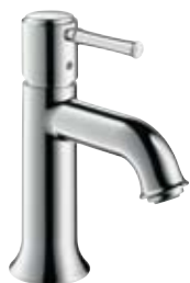
Einhebel-Waschtischmischer # 14111, -000, -820 ohne Ablaufgarnitur # 14118, -000, -820 für offene Heißwasserbereiter # 14115, -000, -820 (o. Abb.)