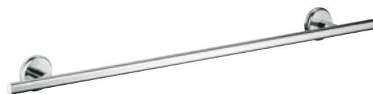
Badetuchhalter 600 mm # 41616, -000, -820