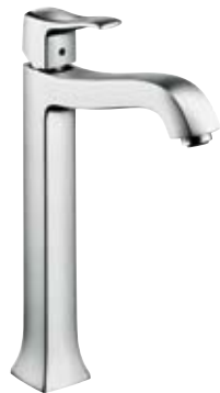
Einhebel-Waschtischmischer Highriser # 31078, -000, -820