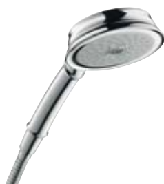
Croma® Classic 100 Multi Handbrause mit Rain-, Mono- und Massagestrahl # 28539, -000, -820