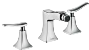
3-Loch Bidetarmatur # 31273, -000, -820