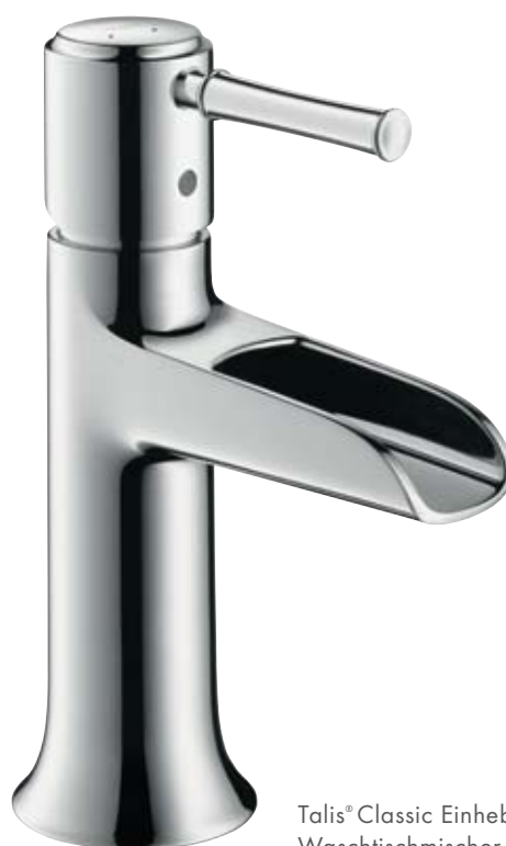
Talis® Classic Einhebel- Waschtischmischer Natural

Talis Classic. Die zurückhaltende, schlanke und zylindrische Grundform ist das bezeichnende Merkmal der Serie. Die klassische Geometrie in der hochgewachsenen Form, ergänzt um die dezenten und feinen Abrundungen in den Abschlüssen – das ist die souveräne, ruhige und gleichzeitig spannende Formensprache von Talis Classic. Die Waschtischarmatur Talis Classic Natural erinnert stark an den Archetyp eines Brunnenauslaufs. Reduziert, ohne überflüssige Rundungen, wird er zu einem modernen Klassiker, der die Einrichtung im Bad durch seine reduzierte Schönheit bestimmt.