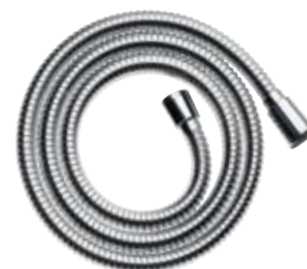
Sensoflex® Brausenschlauch aus Metall mit Kunststoff-Überzug und Drehwirbel 1,25 m # 28132, -000, -820 1,60 m # 28136, -000, -820 2,00 m # 28134, -000, -820

Oberflächen: - 000 chrom - 820 brushed nickel