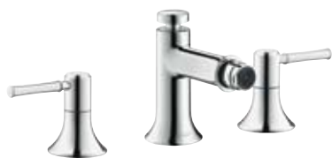
3-Loch Bidetarmatur # 14123, -000, -820