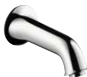
Wanneneinlauf # 14148, -000, -820